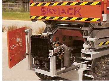
El acceso al motor, montado en la bandeja deslizante, para servicio y mantenimiento es fácil. La guarda de acero lo protege contra daños producidos al caer cualquier material.