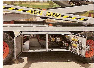
Gabinetes con cierre, de amplia apertura, que permiten fácil acceso a todos los componentes.