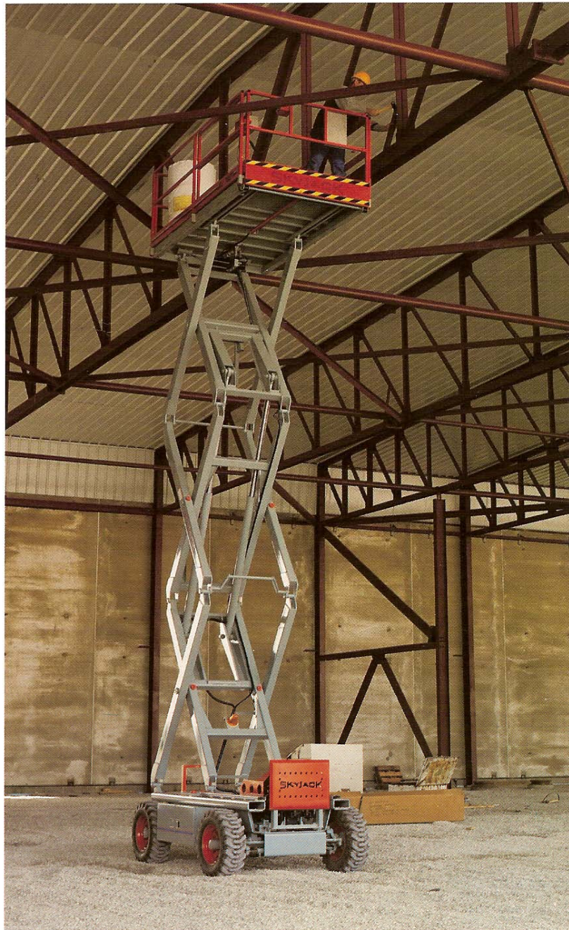
Serie SJ-600, Modelo 7027