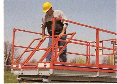
Las barandas superiores articuladas se plegan para reducir al mínimo la altura del equipo plegado, para el transporte o el almacenaje.