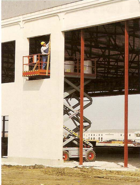
La extensión opcional de la plataforma aumenta el área de trabajo y permite más alcance sobre los obstáculos